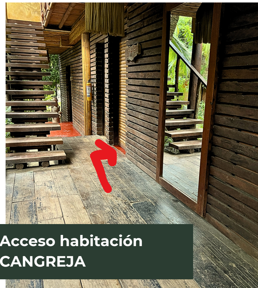
Acceso habitación CANGREJA