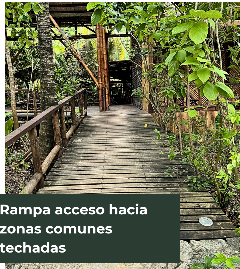
Rampa acceso hacia zonas comunes techadas

Cuando nos visitan huéspedes con movilidad reducida, asignamos una de estas dos habitaciones accesibles para garantizar su comodidad y autonomía dentro del hotel.