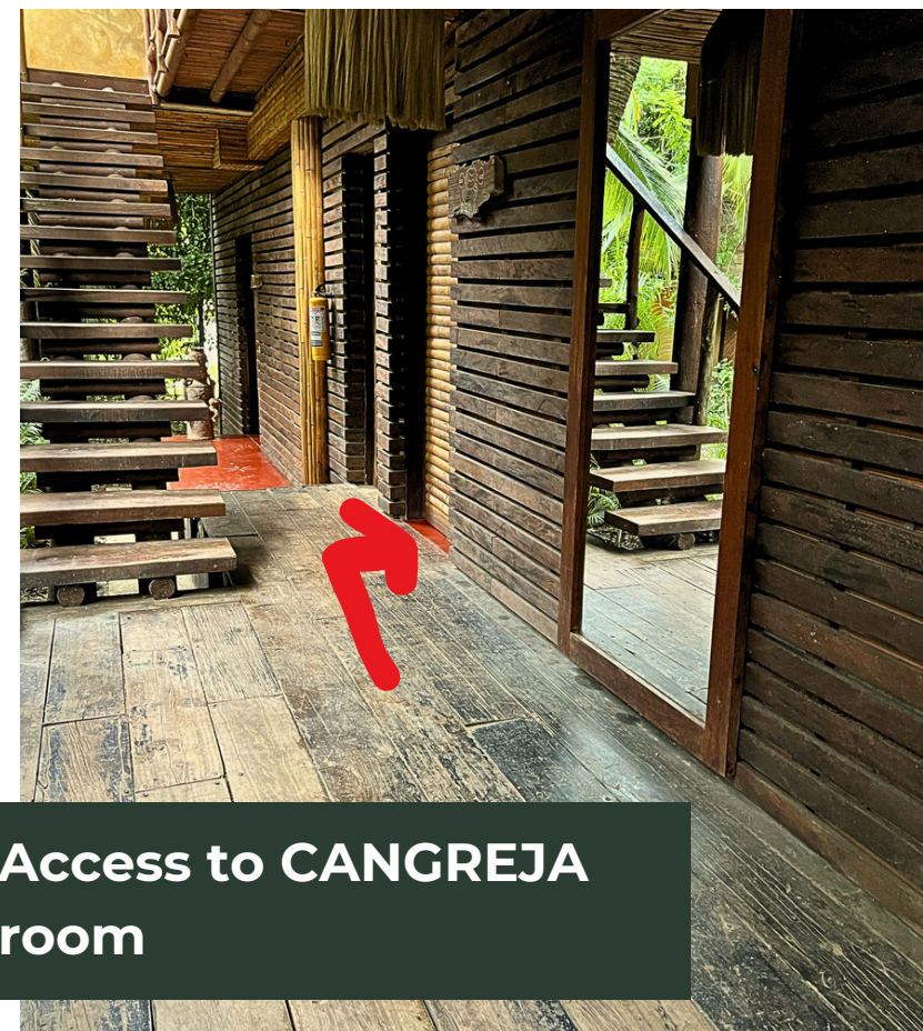
Access to CANGREJA room