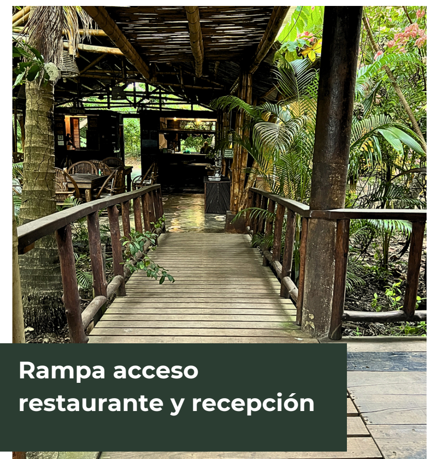
Rampa acceso restaurante y recepción