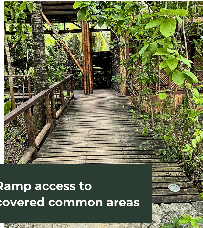
Ramp access to covered common areas

When guests with reduced mobility visit us, we assign one of these two accessible rooms to ensure their comfort and autonomy within the hotel.