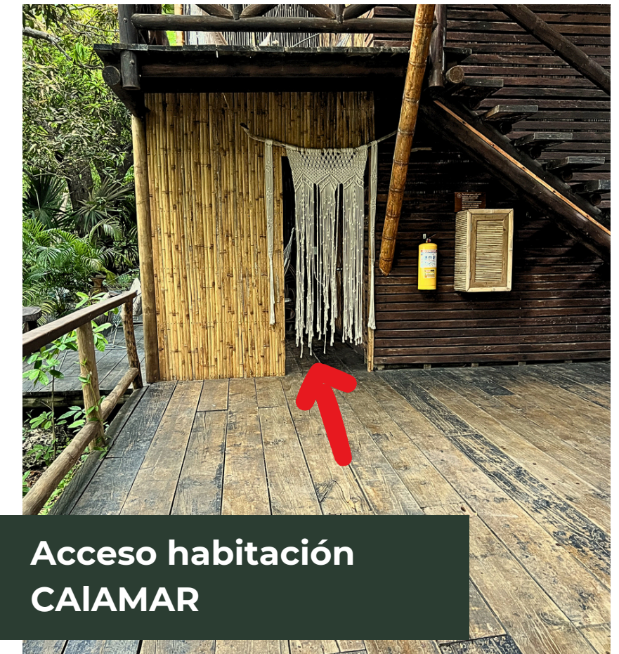
Acceso habitación CAIAMAR